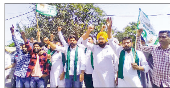
शहजादपुर। अनाजमंडी में आई फसल का जायजा लेते सांसद वरुणा चौधरी।

बायोमिट्रिक की क्या जरूरत है? किसानों का कहना था कि भूमि महिलाओं के व बुजुर्गों के नाम पर है क्या अब हम उन्हें साथ लाएं? किसानों को फसल बेचने के लिए धक्के खाने पड़ रहे हैं। ट्रैक्टर ट्रॉली के नंबर भी अबकी बार लागू कर किसान को इसलिए परेशान किया जा रहा है कि वह तंग होकर या तो अपनी फसल मंडी के बाहर बेचने को मजबूर हो जाएं या फिर खेती ही छोड़ दें।