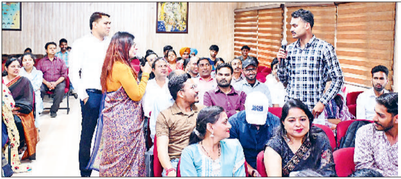
अंबाला। एलुमनी मीट में अपने अनुभव ताजा करते पूर्व छात्र।