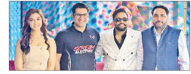
महिंद्रा BE 6 को सिर्फ एक कार नहीं, बल्कि स्टाइल, पावर और नए दौर की पहचान के रूप में दिखाया गया है। महिंद्रा BE 6 अपनी आकर्षक डिजाइन, दमदार लुक और मॉडर्न स्टाइल के कारण युवाओं को काफी पसंद आ रही है। इसकी स्पोर्टी पर्सनेलिटी और म्यूचरिस्टिक डिजाइन गाने की एनर्जी के साथ पूरी तरह मेल खाती है। यही वजह है कि यह कोलैबोरेशन युवाओं के बीच