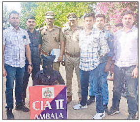
अंबाला। पकड़ा गया आरोपी पुलिस हिरासत में।