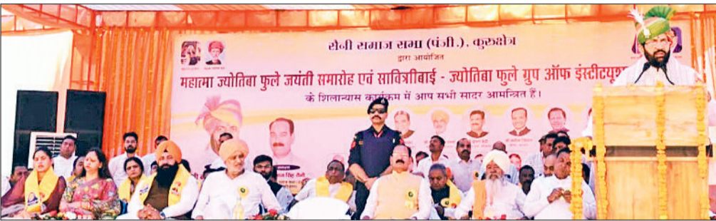
कुरुक्षेत्र। उपस्थित जनों को संबोधित करते मुख्यमंत्री नायब सिंह सैनी।

▶▶ महात्मा ज्योतिबा फुले जयंती समारोह में मुख्यमंत्री नायब सिंह सैनी ने की शिरकत ▶▶ सीएम ने महात्मा ज्योतिबा फुले ग्रुप ऑफ इंस्टीट्यूशन बाबैन की रखी आधारशिला