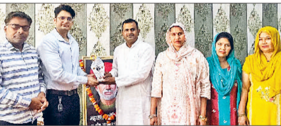
समालखा। अतिथियों को सम्मानित करते हुए मेजबान।