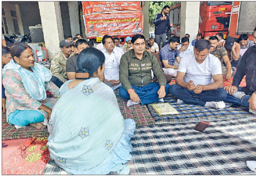
करनाल। धरने पर बैठे दमकल कर्मचारी।