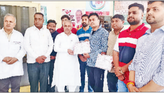
तरावड़ी। रक्तदाताओं को सम्मानित करते हुए।