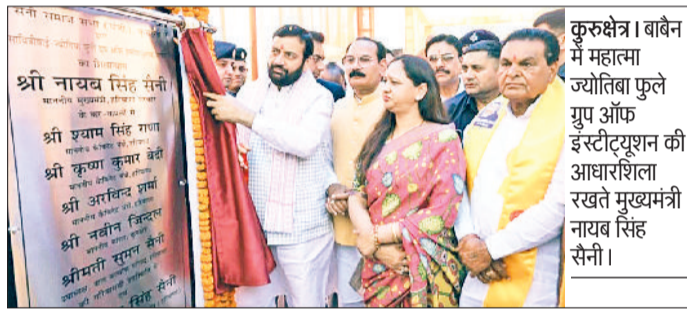
कुरुक्षेत्र। बाबैन में महात्मा ज्योतिबा फुले ग्रुप ऑफ इंस्टीट्यूशन की आधारशिला रखते मुख्यमंत्री नायब सिंह सैनी।

मुख्यमंत्री ने कहा कि महात्मा फुले जी ने केवल शिक्षा तक ही अपने कार्य को सीमित नहीं रखा। उन्होंने समाज के हर उस वर्ग के लिए आवाज उठाई, जो शोषण और अन्याय का शिकार था। आज जब हम 21वीं सदी के भारत में खड़े हैं, तो भी महात्मा फुले जी के विचार अत्यंत प्रासंगिक हैं। प्रधानमंत्री नरेंद्र मोदी के कुशल नेतृत्व में देश सबका साथ, सबका विकास, सबका विश्वास और सबका प्रयास के मंत्र पर गति से बढ़ रहा है। यह मंत्र उस समावेशी सोच का प्रतीक है, जिसकी नींव महात्मा फुले जी ने रखी थी। आज सरकार की विभिन्न योजनाएं—चाहे वह गरीबों के लिए आवास हो, स्वास्थ्य सुविधाएं हों या स्वच्छता अभियान—सभी का उद्देश्य समाज के अतिमन्यव्यक्त तक विकास की रोशनी पहुंचाना है। इसी उद्देश्य के अनुरूप हमने हरियाणा में जनहित में अनेक निर्णय लिए हैं।